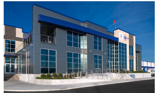
Refrigerated Distribution Center for U.S. Cold Storage Covington, Tennessee