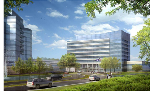
Fairfax County Public Safety Center and Parking Headquarters Fairfax, Virginia

©2016 Geopier Foundation Company, Inc. La tecnología Geopier® y las marcas de fábrica están protegidas bajo patentes de los EUA y marcas de fábrica listadas en www.geopier.com/patents y otras aplicaciones de marca y patentes pendientes. Existen otras patentes extranjeras, aplicaciones de patentes, marcas registradas y marcas de fábrica.