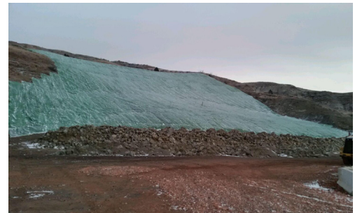
Carus Well Pad Slope Stabilization Near Killdeer, North Dakota