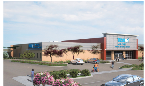
All-Care Animal Hospital Addition Fountain Valley, California